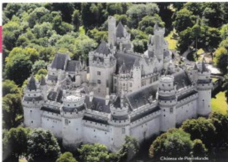
Château de Pierrefonds

* Le Centre des monuments nationaux ne pourra être tenu pour responsable de la fermeture exceptionnelle, partielle ou totale, d'un de ses sites. Les monuments nationaux sont pour le pluspart fermés les 23 décembre, 1 er janvier, 1 er mai, 1 er et 11 novembre. Se renseigner au préalable.