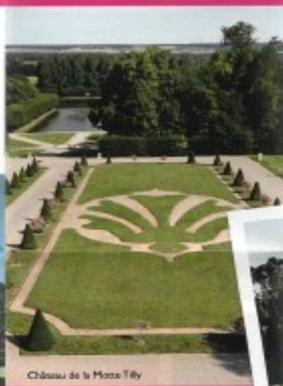
Château de la Motte Tilly