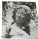
Tour de la cathédrale de Reims