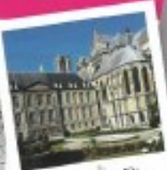
Palais de Tau à Reims